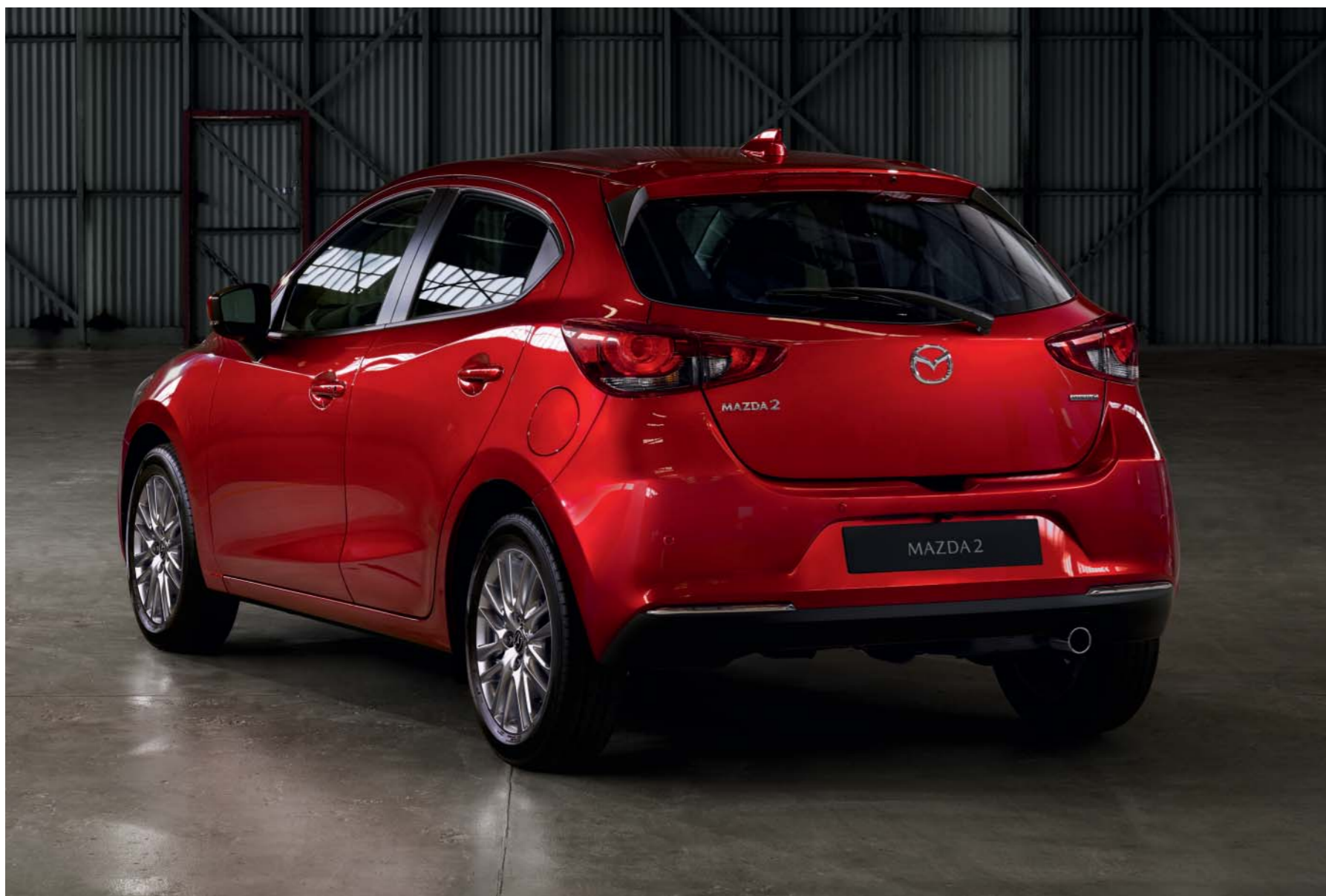
A képen egy Soul Red Crystal színű Mazda2 látható. A felszereltségi szint országonként eltérhet.